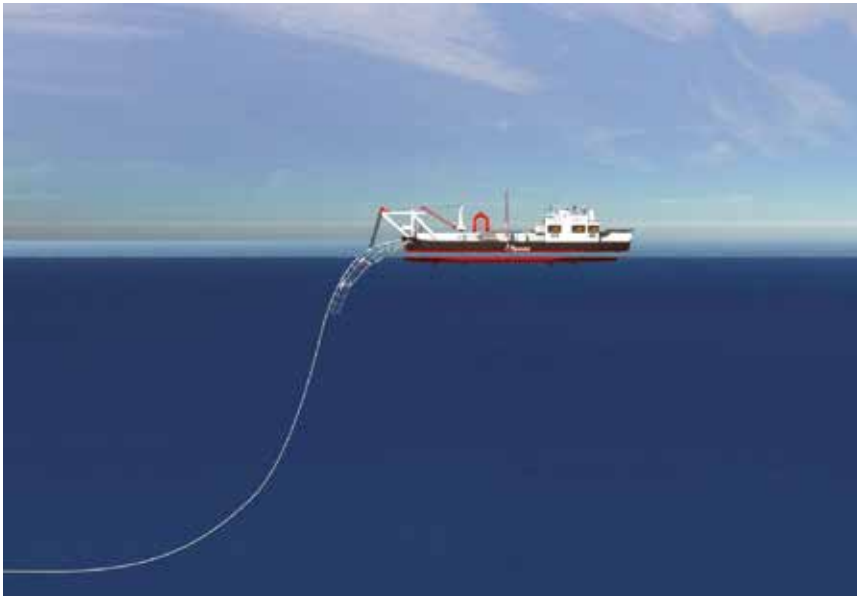
Početak podmorskog ispusta u Omišu

promjene zakonske regulative potrebna je i dogradnja biološkog dijela UPOV-a. Kompletiranje sustava odvodnje i pročišćavanja planira se uz subvencioniranje EU-ovih fondova pa je u tijeku izrada potrebne studijske i tehničke dokumentacije.