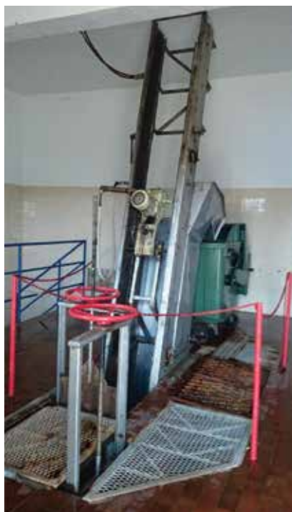
Mehaničko pročišćavanje otpadnih voda – ulazna rešetka

U većini se slučajeva za pročišćavanje otpadnih voda primjenjuje SBR ( sequencing batch reactor – sekvencijski šaržni reaktor) tehnologija, s većim brojem spremnika u kojima se obavlja biološko pročišćavanje i taloženje. Tako se ujedno mogu omogućiti i prilagodbe varijacijama u dotoku. Na SBR uređajima mogu se zadovoljiti i zahtjevi za redukciju dušika i fosfora, dakako ako se takvi zahtjevi (primjerice ispust u osjetljivo more) postavljaju. Kako bi se zadovoljilo još strože zahtjeve ispuštanja, može se predvidjeti i gradnja MBR ( membrane bioreactor – membranski bioreaktor) uređaja, kojim se postiže vrlo visoki stupanj pročišćavanja uz korištenje membranske tehnologije. Ipak, valja istaknuti to da je u