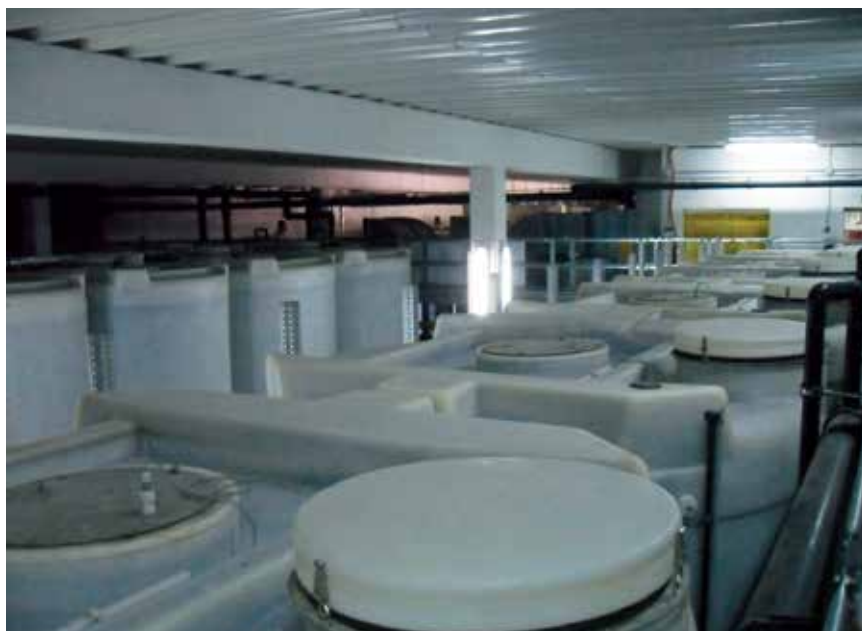
Suvremeni UPOV s biološkom obradom i fleksibilnim kapacitetom

Ako se žele iskoristiti sredstva iz EU-ovih fondova, osnovni je uvjet izrada studije izvodljivosti (SI) u kojoj treba detaljno analizirati sve potrebe. Zato su rezultati analize potreba iz SI-a svrsishodan ulazni podatak za projektiranje sustava odvodnje i pročišćavanja otpadnih voda na području obalnih aglomeracija. Potrebe za vodom određene u SI-u uglavnom daju podatke o srednjoj potrošnji koja će se ostvarivati u planskome razdoblju i na temelju toga se izračunavaju i prihodi od prodaje vode. Kako prognoze prihoda ne bi izišle iz stvarnih okvira, često se predviđa malo ili umjereno povećanje potrošnje. S druge strane projektanti, čija je zadaća dimenzioniranje sustava, obično radi sigurnosti, gotovo uvijek daju optimističnije prognoze povećanja potrošnje. Prilikom dimenzioniranja sustava odvodnje i pročišćavanja primjenjuju se i koeficijenti varijacije potrošnje (dnevna i satna potrošnja), kojima se djelomično mogu ublažiti dijametralno suprotne postavke vezane uz prognozu povećanja