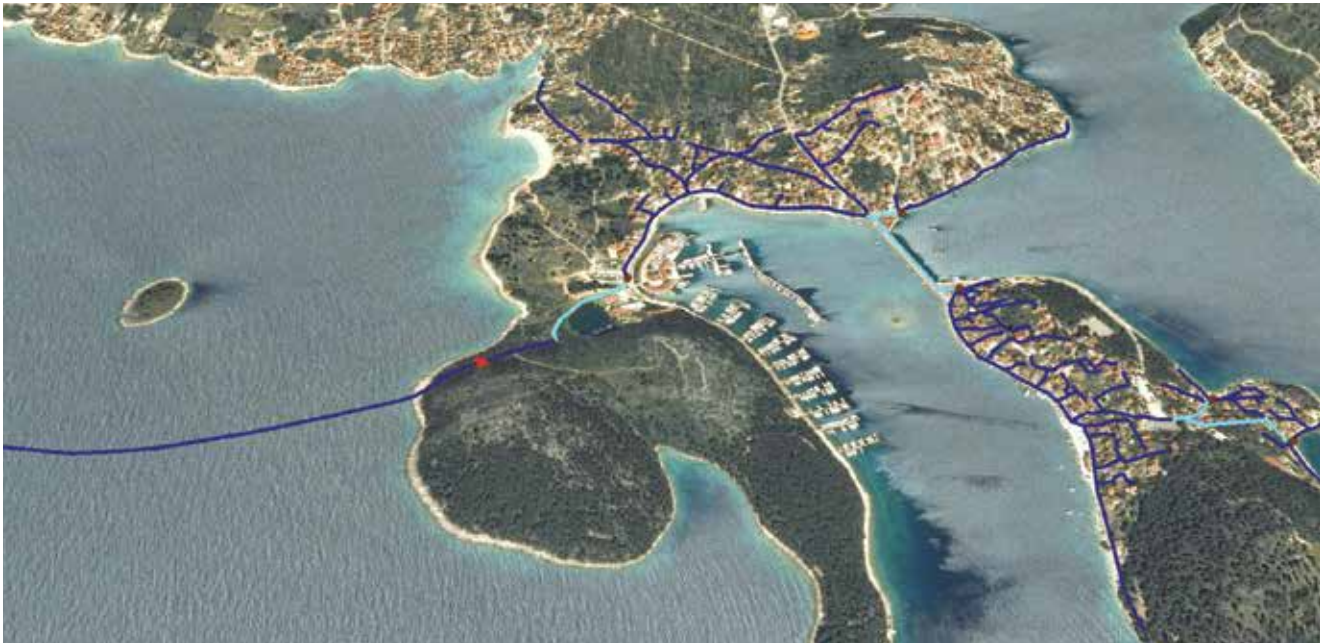
Postojeća konfiguracija kanalizacijskog sustava u Rogoznici