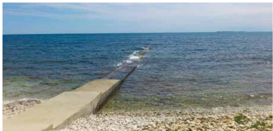
Početak podmorskog ispusta

ti i održivi razvoj. Ne bi trebalo zanemariti ni činjenicu da uspostava novih turističkih zona podrazumijeva rješavanje imovinskopravnih odnosa, ali i gradnju kompletne infrastrukture (prometnica, vode,