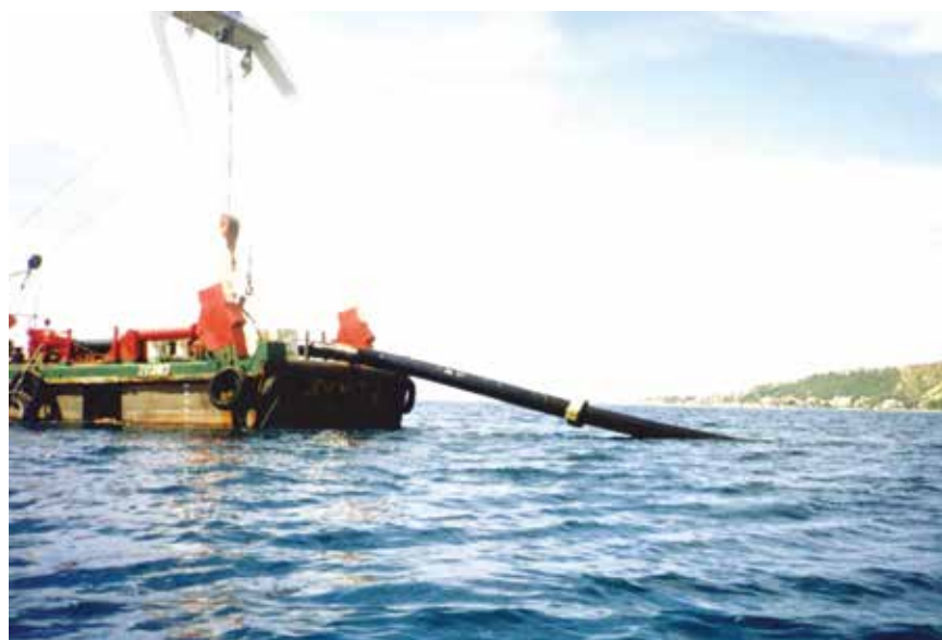
Gradnja podmorskog ispusta kanalizacijskog sustava u Omišu

Osnovna je konfiguracije kanalizacijskog sustava Omiša uspostavljena na temelju tehničke dokumentacije tvrtke Dippold & Gerold - Hidroprojekt 91 koja je izrađena u devedesetim godinama prošlog stoljeća. Nakon toga uslijedila je i izgradnja UPOV-a (mehanički tretman) i pripadajućega podmorskog ispusta pa su time uspostavljeni osnovni uvjeti za odlaganje otpadnih voda u skladu s ondašnjom zakonskom regulativom.