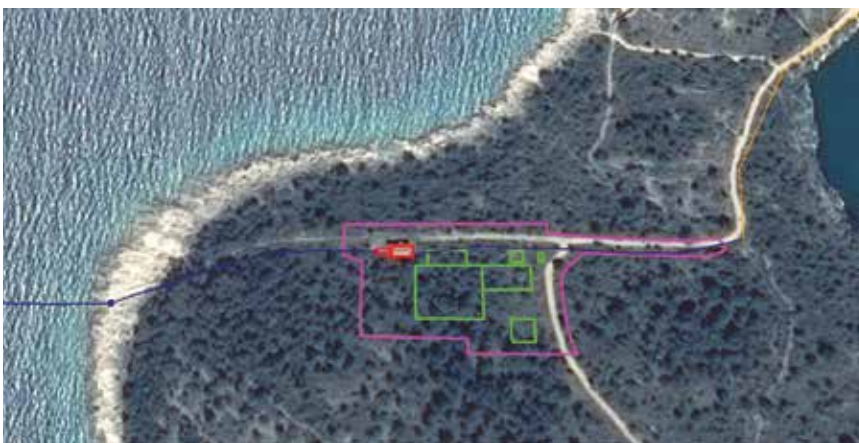
Prijedlog parcelacije i dispozicija glavnih građevina UPOV-a Rogoznica