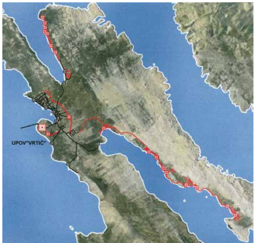
Planirana dogradnja kanalizacijskog sustava na području Novalje

Tvrtka Dippold & Gerold - Hidroprojekt 91 danas sudjeluje u projektima s kojima se rješavaju problemi odvodnje i pročišća-