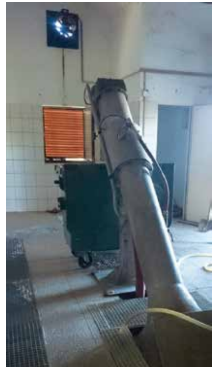
Automatska rešetka (sito) na početku podmorskog ispusta

Međutim, već su danas turistički kapaciteti uglavnom dosegli visoku razinu iskoristivosti prostora pa su daljnja proširenja upitna, osobito ako se želi zadržati